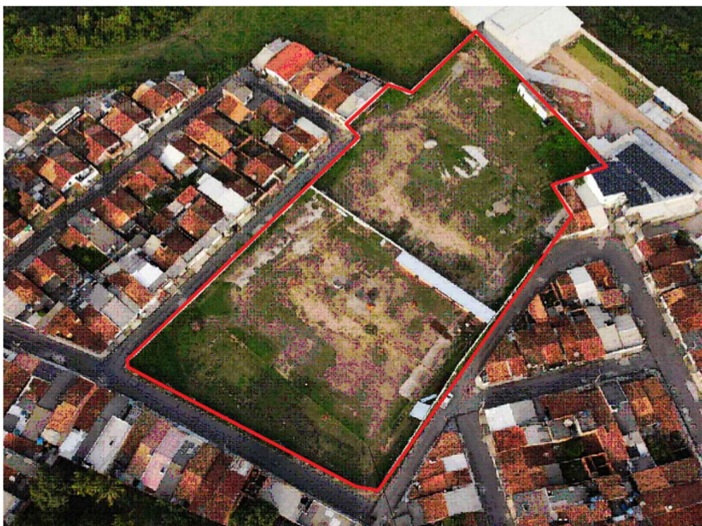
Figura 03: área do antigo campo.

Documento assinado digitalmente gov.br LEANDRO DE ASSIS FERREIRA Data: 26/11/2025 22:56:07-0300 Verifique em https://validar.iti.gov.br